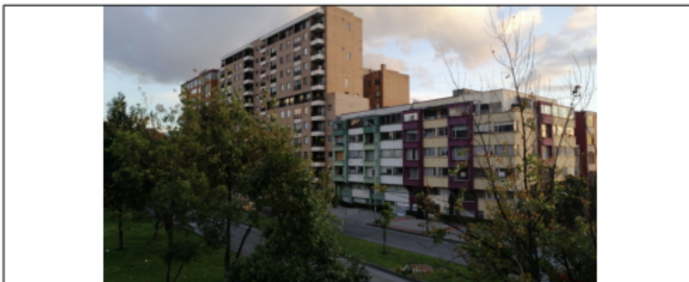
Foto No.1: Vista panorámica del predio, en donde estaba ubicado el elemento, en la Calle 22 F No. 44-77 (dirección de registro) y/o Avenida Calle 26 No. 44 A -77 (dirección catastral) orientación Oeste-Este.