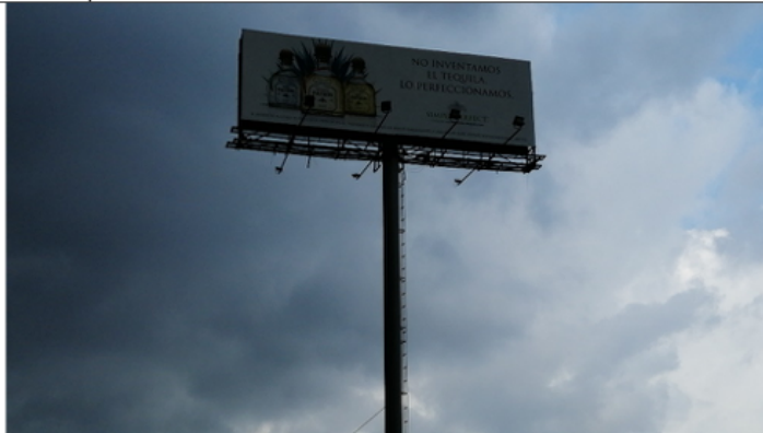
Foto No.2: Vista del panel y de la estructura de la valla, en buenas condiciones y estable.