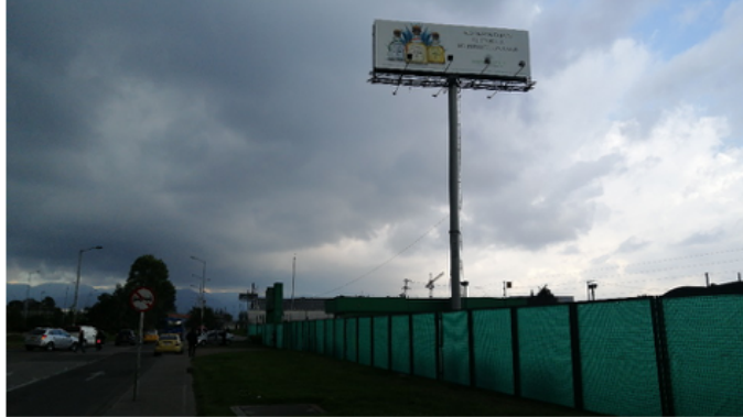
Foto No.1: Vista panorámica del predio, y de la valla ubicada en la Av. Calle 26 No. 96 A-21 (Dirección Catastral) sentido Oeste-Este.